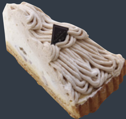
アイスモンブラン