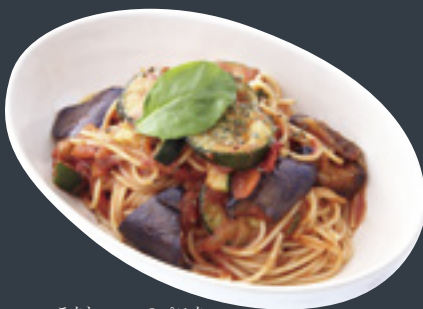
ラタトゥーユのパスタ