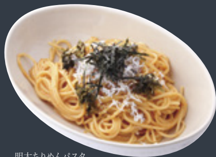
明太ちりめんパスタ

ソースは、ナスなどの夏野菜をトマトで煮込んだラタトゥーユ。食欲をそそるほどよいピリ辛