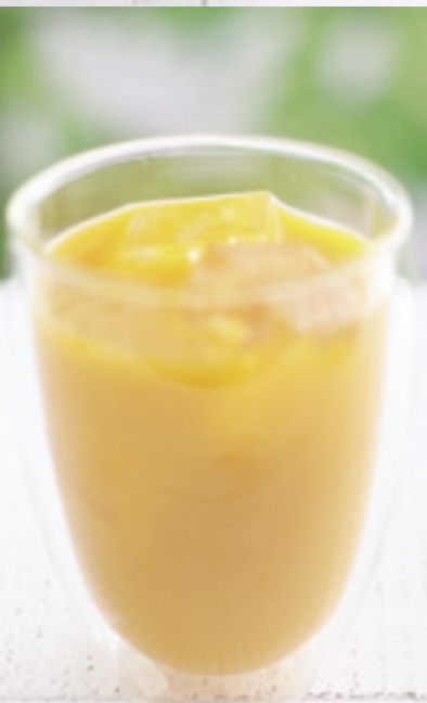
マンゴージュース