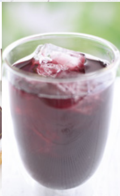
信州巨峰ストレートジュース

白桃×桃ゼリーの芳醇な香りと味が口の中に広がる。タルト生地の上には杏仁クリームが