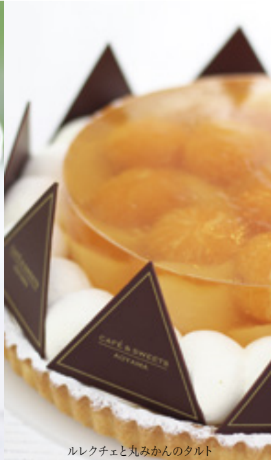
ルレクチェと丸みかんのタルト