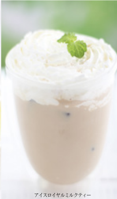
アイスロイヤルミルクティー