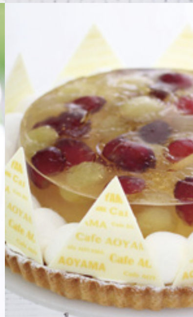
ピオーネとマスカットゼリーのタルト

長野県にあるアルプスワイナリーが作ったストレートジュース。ブドウのうまみが口いっぱいに広がる