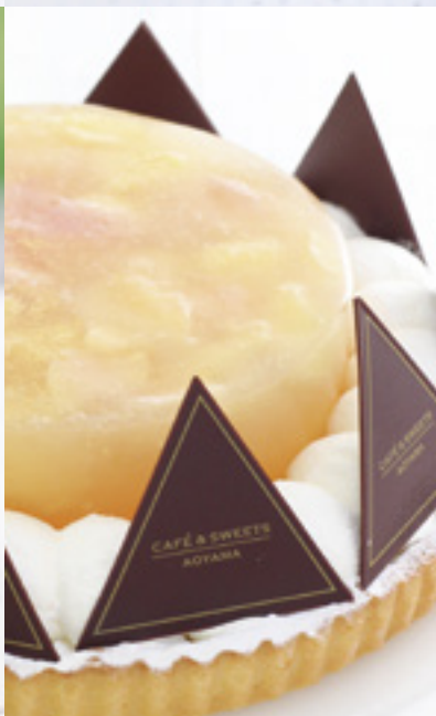
白桃と杏仁のタルト

濃厚な風味と甘さは、まさにマンゴーをそのまま味わっているよう。夏にぴったりのジュース